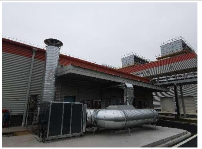
危废仓库废气处理设施