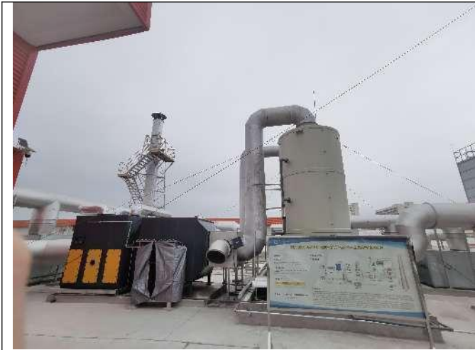
污水处理站废气处理设施