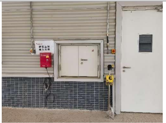
化学品仓外侧静电消防器