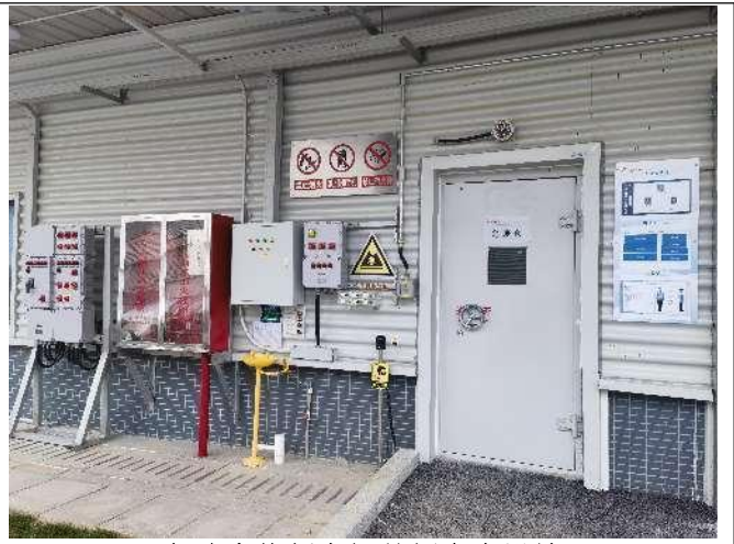
危险废物暂存间外侧安全设施