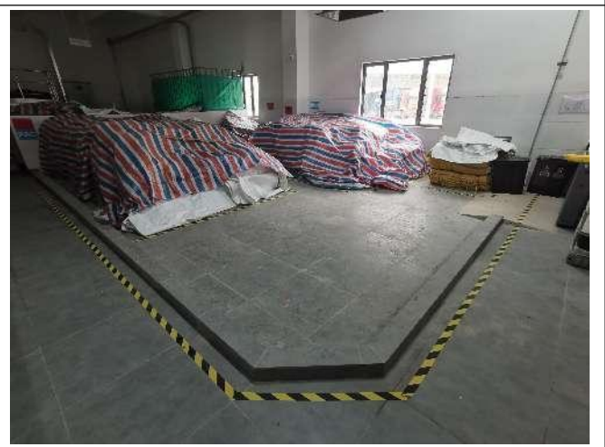
污水处理站防泄漏围堰