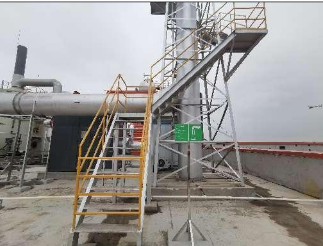
生产车间废气排气筒