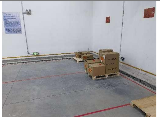
化学品存放间围堰