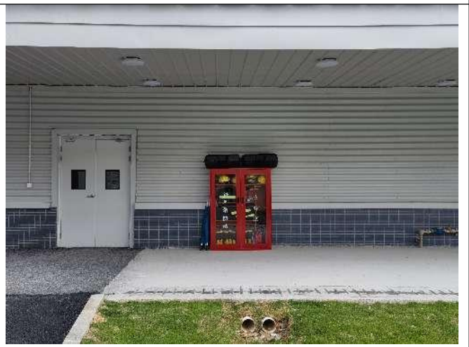
各区域应急物资柜