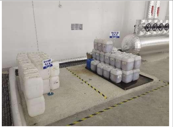
锅炉房药剂区防泄漏围堰