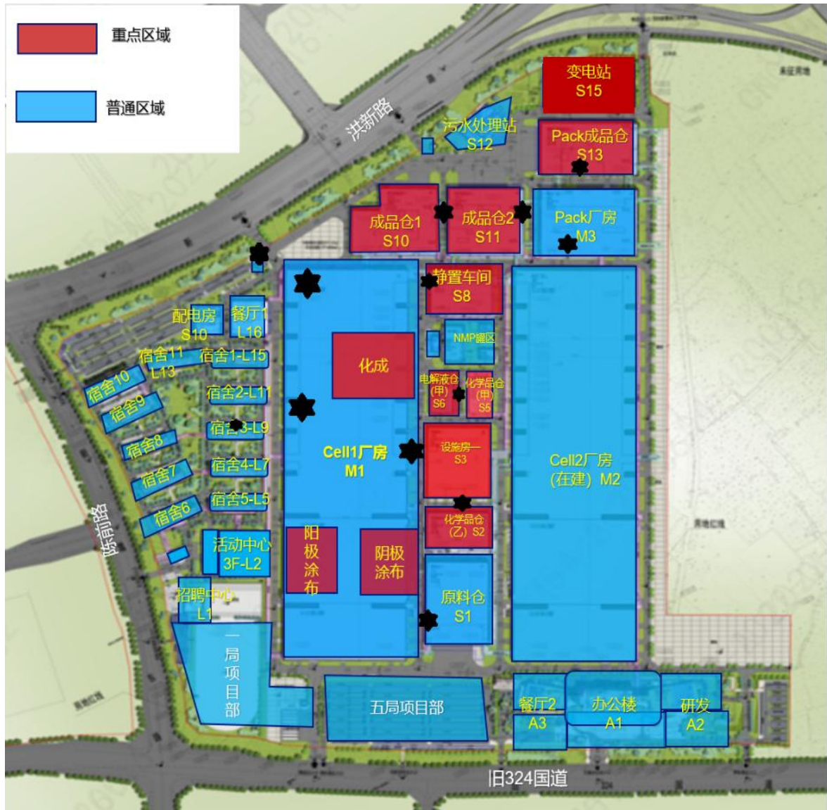
公司应急物资分布图