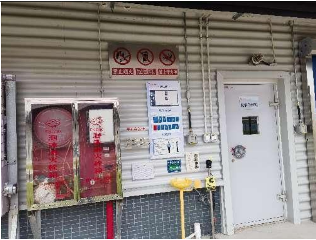
化学品仓外侧安全设施